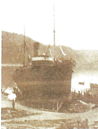
Harstad Mek. Verksted.

Etter en del fusjoner og navneendringer fremstår nå bedriften som en avdeling av Norsk Stål AS, som er Norges største stål- og metallgrossist.